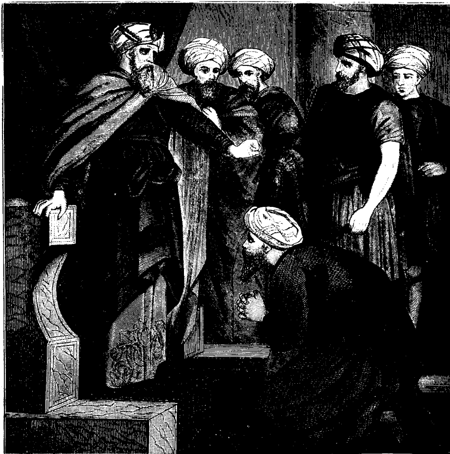
Милостивый царь и безжалостный рабъ.

нимъ назначаю вамъ царство. «А кто», продолжалъ далѣе Иисусъ, «соблазнить одного изъ малыхъ сихъ, вѣрующихъ въ Меня, тому лучше было-бы, если-бы повѣсили ему мельничный жерновъ на шею и потопили его въ глубинѣ морской. Невозможно не прійти соблазнамъ въ миръ, но горе тому человѣку, чрезъ котораго соблазнъ приходитъ. Смотрите, не презирайте ни одного изъ малыхъ сихъ, ибо говорю вамъ, что Ангелы ихъ на небесахъ всегда видятъ лице Отца Моего небеснаго».