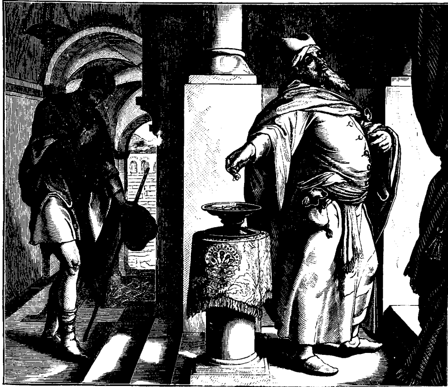
Мытарь и фарисей.

Одинъ разъ ученики, приступивъ къ Иисусу Христу, спрашивали Его: «кто больше въ царствѣ небесномъ?» Иисусъ, не отвѣчая прямо на слова ихъ, привелъ дитя и, поставивъ его посреди учениковъ, сказалъ: