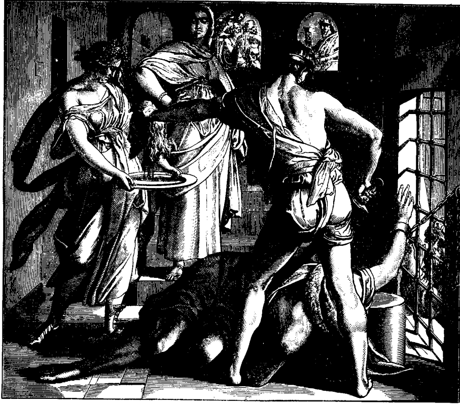
Усѣкновеніе главы Іоанна Крестителя.

собственное его уваженіе къ сему святому лицу опечалили на время Ирода; но, ради клятвы и ради возлежащихъ съ нимъ, онъ не рѣшился отказать дѣвицѣ въ просьбѣ. Онъ тотчасъ послалъ стража въ темницу, который отсѣкъ голову Іоанна, принесъ ее на блюдѣ и подалъ Саломіи,