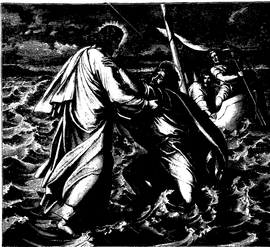
Иисусъ Христосъ спасаетъ утопающаго Петра.

повели мнѣ прійти къ Тебѣ по водѣ». Христосъ отвѣтилъ: «иди». Петръ вышелъ изъ лодки и пошелъ по водѣ, чтобы подойти къ Иисусу; но, испугавшись сильнаго вѣтра и начавъ тонуть, вскричалъ: «Господи, спаси меня». Иисусъ протянулъ руку и, поддержавъ Петра, сказалъ ему: