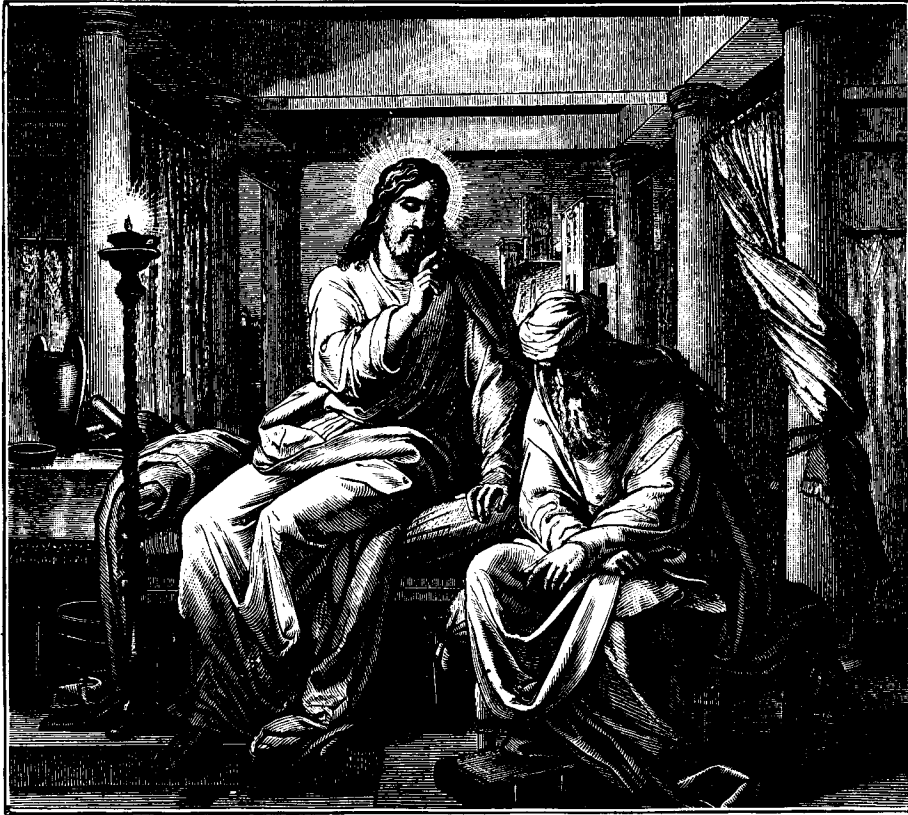
Беседа Иисуса Христа съ Никодимомъ.

употребилъ слѣдующее уподобленіе: «Духъ дышетъ, гдѣ хочетъ, и гласъ его слышишь, не знаешь, откуда приходитъ и куда уходитъ: такъ бываетъ со всякимъ, рожденнымъ отъ Духа». То есть—тебѣ непонятно такое возрожденіе? Это и не удивительно. Вотъ дуетъ вѣтеръ; онъ тамъ и здѣсь; ты слышишь движеніе и шумъ его, но не знаешь, откуда онъ приходитъ, и куда идетъ. Такъ и въ духовномъ рожденіи Всемогущій Духъ Святой дѣйствуетъ сокровенно, но тѣмъ не менѣе ощутительно для возрождаемаго, и ты, не достигая тайны, долженъ вѣровать оной. Ни-