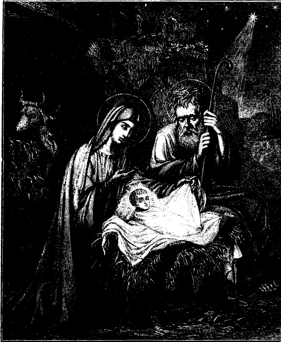
Рождество Исуса Христа.

и наречешъ Ему имя Исусъ, ибо Онъ спасеть людей своихъ отъ грѣховъ ихъ. Все это произошло, да сбудется сказанное Господомъ чрезъ пророка: се. Дѣва во чревѣ приметъ и родить сына, и нарекутъ имя Ему Ем-