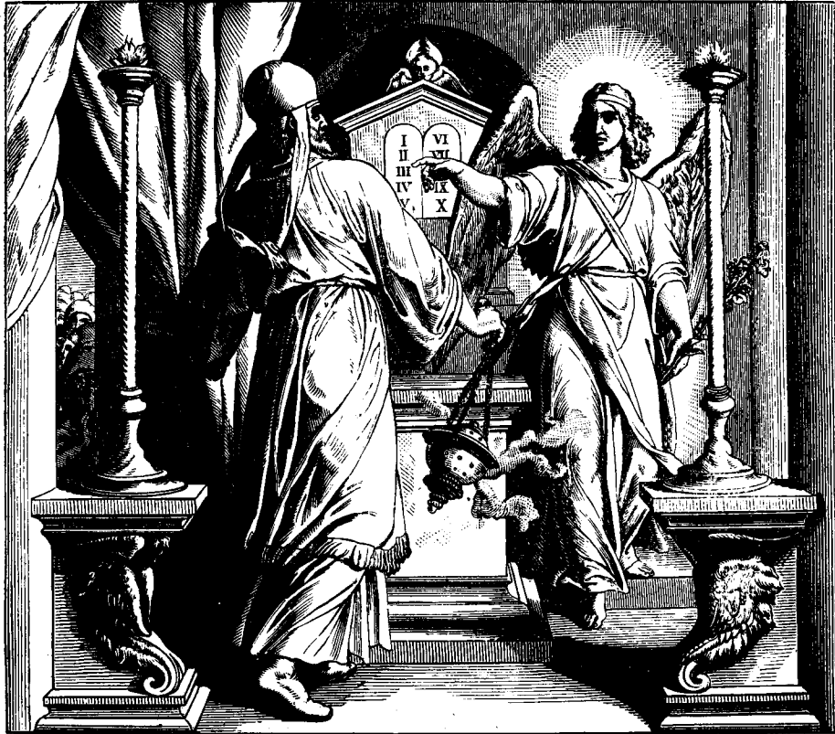
Ангель являеться Захаріи.

Народъ между тѣмъ ожидалъ Захарію и дивился, почему онъ медлитъ въ святилищѣ. Вышедши же къ народу, Захарія не могъ ничего говорить. Всѣ поняли, что онъ видѣлъ видѣніе въ святилищѣ. Захарія объяснился съ народомъ знаками и оставался нѣмъ. Когда кончились дни службы его, Захарія возвратился въ домъ свой. Вскорѣ послѣ этого Елизавета зачала; но она таилась пять мѣсяцевъ, и въ тайнѣ прославляя Бога Благодѣтеля и благодаря Его, говорила: «Такъ сотворилъ мнѣ