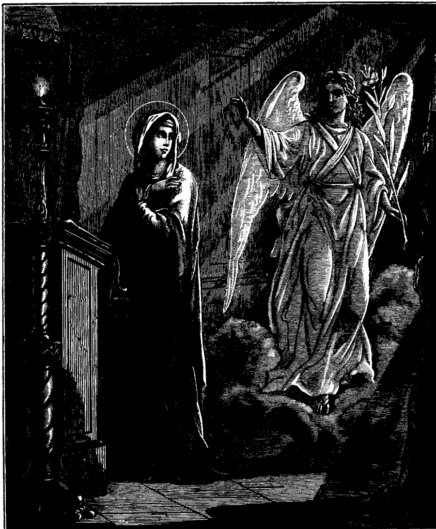
Благовѣщеніе Пресвятой Богородицы.

уже не было въ живыхъ. Оставаться при храмѣ ей, какъ совершенно-лѣтней, по обычаю, нельзя было; поэтому ее обручили дальнему родственнику ея, старцу Іосифу, тоже изъ рода Давидова, и жившему также