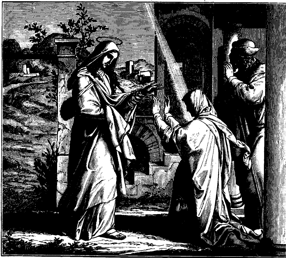
Посѣщеніе Девойю Марією Елизаветы.

отъ словъ его и подумала про себя: «Что-бы это было за привѣтствіе?» Ангель сказалъ ей: «Не бойся, Марія (то есть—не смущайся тѣмъ, что слышишь необычайное о тебѣ); ибо ты обрѣла благодать у Бога, и вотъ зачнешь во чревѣ, родишь сына и наречешь имя ему—Иисусъ. Онъ будетъ великъ и наречется сыномъ Всевышняго. Господь Богъ дастъ Ему престолъ Давида, отца Его. Онъ будетъ царствовать надъ домомъ Іакова во вѣки, и царству Его не будетъ конца». Марія въ недоумѣніи спросила Ангела: «Какъ будетъ это, когда я мужа не знаю?» Ангель