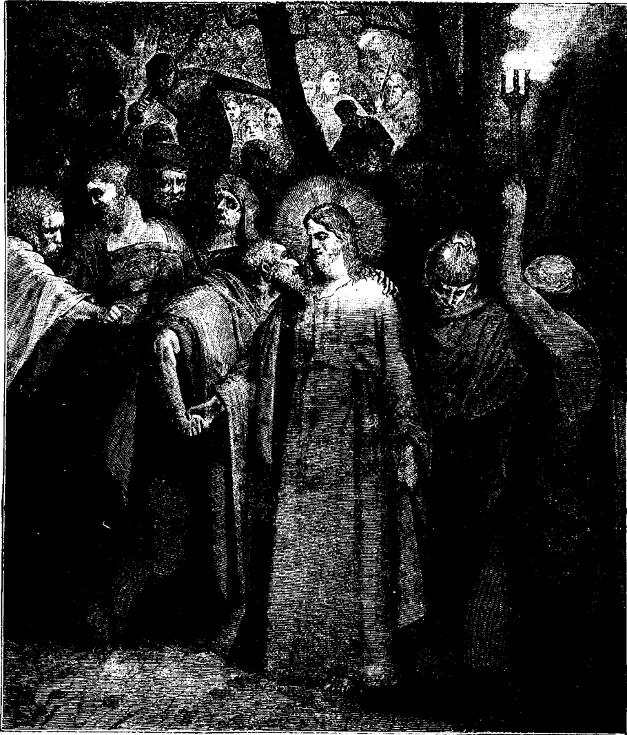
Взятіе Іисуса Христа.

«Иисуса Назарея». Христось сказалъ имъ: «это Я». Услышавъ эти слова, они такъ были поражены, что отступили назадъ и пали на землю. Иисусъ Христось въ другой разъ спросилъ ихъ: «кого ищете?»