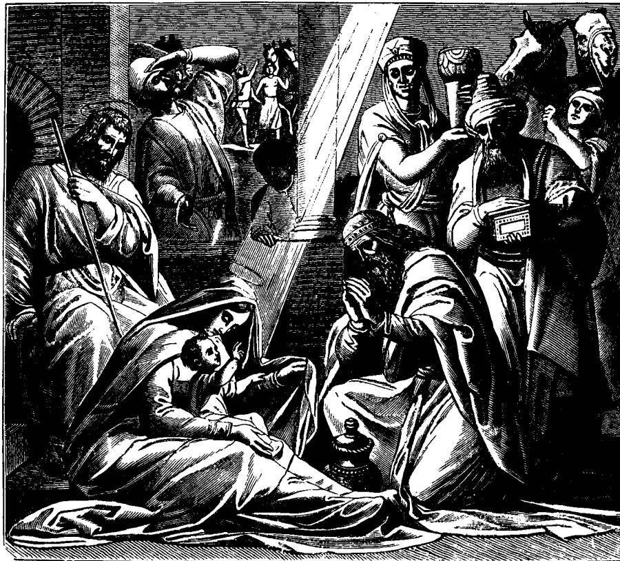
Поклоненіе волхвовъ родившемуся Спасителю.

выслушавъ Ирода, пошли въ Вифлеемъ. И вотъ звѣзда, которую они видѣли на востогѣ, опять явилась на небѣ и пошла передъ ними, доколѣ, наконецъ, пришла и остановилась надъ тѣмъ самымъ мѣстомъ въ Вифлеемѣ, гдѣ находился Младенецъ. Увидѣвши, что звѣзда остановилась, волхвы возрадовались весьма великою радостію. Войдя въ домъ, они увидѣли Младенца съ Маріею, матерью Его, пали, поклонились