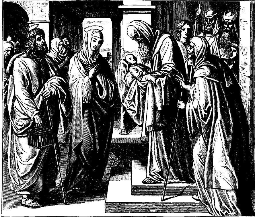
Симеонъ встрѣчаетъ Младенца Иисуса въ храмъ.

Въ сороковой день, когда исполнились дни очищенія, Иосифъ и Марія принесли Младенца Иисуса въ Иерусалимъ, чтобы представить Его предъ Господа, то есть во храмъ на руки священника, и чтобы принести жертву по закону. Но какъ бѣдность не позволяла имъ принести въ жертву овна, то они принесли двѣ горлицы или двухъ птенцовъ голубиныхъ. Въ то время въ