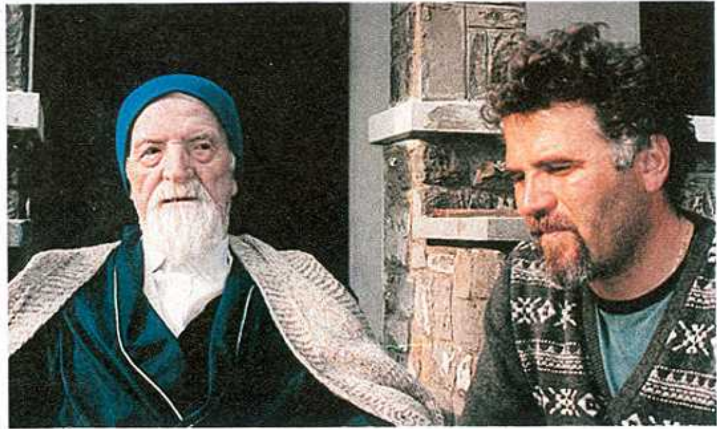
Στήν φωτογραφία ὁ π. Δημήτριος Στανιλοάε μαζί μέ τόν κ. Γεώργιο Παπαευνθυμίου, στόν ὁποῖο καί παραχώρησε τήν συνέντευξη τόν Αὐγουστο τοῦ 1993 στήν Ρουμανία.

Ἐκείνη τήν ὥρα ἡμεῖς ἔχουμε ἕνα ἕνα ἔθνος ἑναντίον ἄλλου ἔθνους. Διατηροῦμε τήν σχέση μεταξύ Ἐκκλησίας καί κάθε ἔθνους καί χρησιμοποιοῦμε τήν Ἐκκλησία γιά τήν ἐνότητα κάθε ἔθνους, ἀλλά νά μήν ἐπιζητοῦμε τήν ὑπεροχή ἑνός ἔθνους, ἐναντίον ἄλλου ἀλλά νά ὑπολογίζουμε ὅτι ὅλα τά ἔθνη καθοδηγοῦνται ἀπό τόν ἴδιο Χριστό, ἀπό τόν ἴδιο Σταυρό τοῦ Χριστοῦ ὅπως ὁ Σωτήρας λέει: «Πορευθέντες μαθητεύσατε πάντα τά ἔθνη βαπτίζοντες αὐτούς εἰς τό ὄνομα τοῦ Πατρὸς καί τοῦ Υἱοῦ καί τοῦ Ἁγίου Πνεύματος» (Ματθ. 28,19). Νά βαπτιστοῦμε ἐν Χριστῷ καί νά δείξουμε ὅτι ὑπάρχει μία ἐνότητα μεταξύ μας, μία ἐνότητα χωρίς σύγχυση διατηρώντας κάθε ἔθνος τὰ ἰδιαίτερα χαρακτηριστικά γνωρίσματά του. Ἡ Ἐκκλησία γιά παράδειγμα ἀνέπτυξε αὐτό τό ὁποῖο εἶναι χαρακτηριστικό στόν Ρουμανικό λαό, τόν Σερβικό, τόν Ἑλληνικό λαό. Αὐτό δέν σημαίνει ὅμως ὅτι πρέπει νά ἐκδηλωνόμαστε ὁ ἕνας ἐναντίον τοῦ ἄλλου ἀλλά νά μάθου-