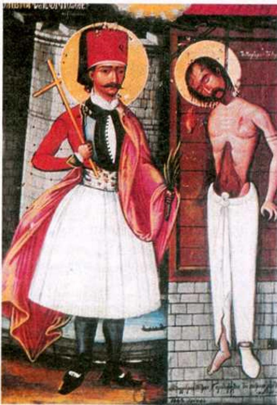
Ο άγιος νεομάρτυς Γεώργιος ο έξ Ίωαννίνων.

Είναι γνωστό ότι ή άγιότητά τους άναγνωριζόταν από τό δούλον