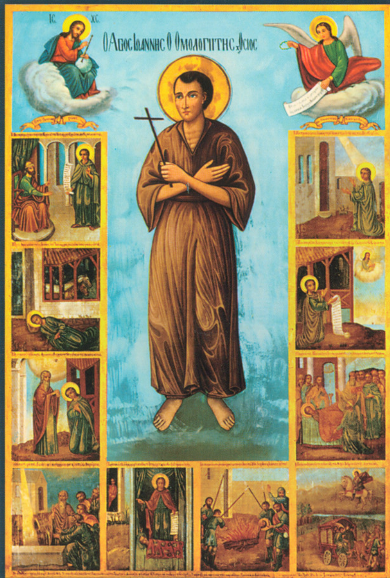
Ἡ ἀρχαιότερα εἰκόνα τοῦ Ὁσίου Ἰωάννου τοῦ Ῥώσου, μέ παραστάσεις ἀπό τήν μαρτυρική ζωή καί θαύματα τοῦ Ἁγίου. Φυλάσσεται στόν Ναό Του στό Προκόπιο Εὐβοίας.