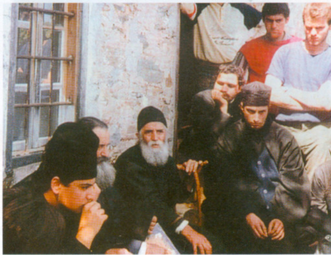
Ὁ Γέροντας Παῖσιος συνομιλῶντας μέ προσκνηντές ἔξω ἀπό τό κελλί του στήν Παναγούδα.

τούς διεθνεῖς ναυτικούς κανονισμούς, τό ἔκρουσε κάτω ἀπό τό μακρῦ φουστάνι της ἐπί ἑννέα ὥρες, ὡσπου ἔφτασαν στόν Πειραιᾶ, γιά νά τό κηδέψει ἐκκλησιαστικῶς. Ἐκεῖ μόλις ἀποβιβάστηκαν, τό φαινόμενο ὡς νεκρό δρέφος ἔβαλε τά κλάμματα. Ξαναζωντάνεψε μέ τήν Χάρη τοῦ Θεοῦ, γιά νά ζωντανέψει στίς μέρες μας ἀμέτρητες νεκρές ψυχές καί νά τίς στηρίξει στήν πορεία τῆς ζωῆς μέ τίς ἅγιες καί σοφές συμβουλές καί τίς πυρακτωμένες προσευχές του.