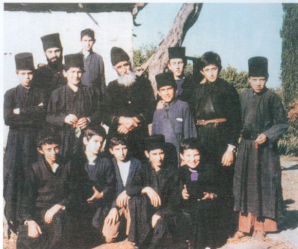
‘Ο Γέροντας Παΐσιος με τόν Οἰκουμενικό Πατριάρχη κ. Βαρθολομαῖο καί μέ τούς μαθητές τῆς Ἀθωνιάδας Σχολῆς.